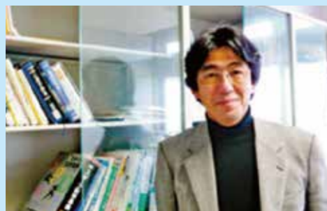
九州工業大学大学院生命体工学研究科 脳情報専攻人間環境学博士

トレーニング前後に行った新ストループ検査Ⅱ(認知機能検査)で測定した結果、有意な主効果が認められました。